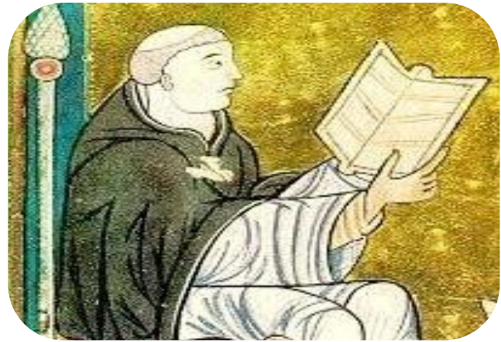
Hugo van St. Victor (±1097–1141)